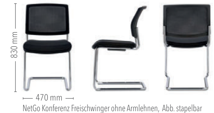
NetGo Konferenz Freischwinger ohne Armlehnen, Abb. stapelbar