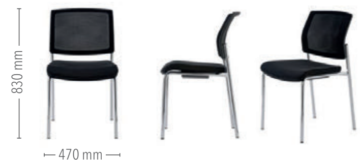
Vierfuß Konferenz ohne Armlehnen