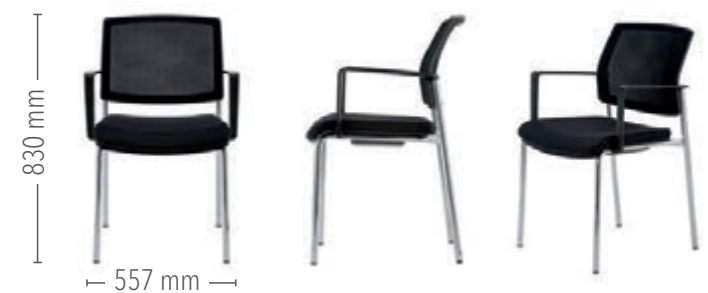
Vierfuß Konferenz, mit Armlehnen

Für den robusten Einsatz ist der Vierfuß Konferenz auch ohne Polster mit einer Kunststoff-Sitzschale erhältlich.