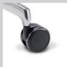
Rollen hart (für Teppich)