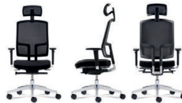
Wahlweise mit Kopfstütze erhältlich