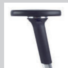
4D Multifunktionsarmlehne NPR