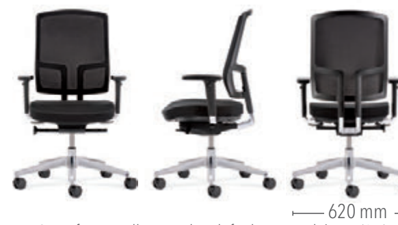
Mit Sitztiefeverstellung und Multifunktionsarmlehnen (3D) Gestell in Aluminium poliert