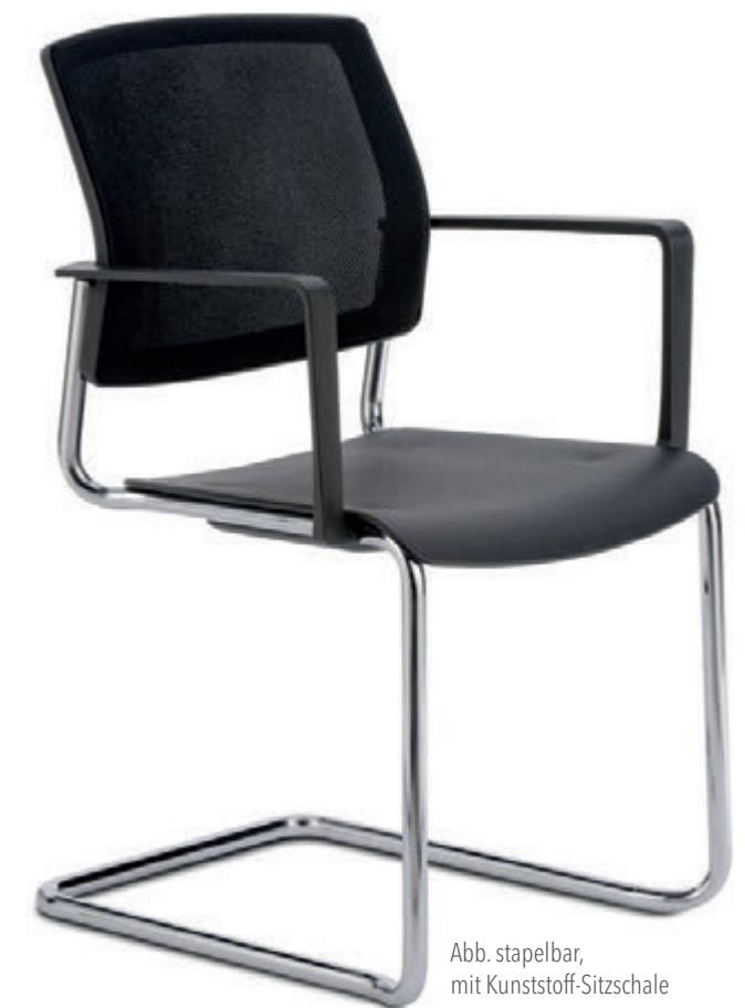
Abb. stapelbar, mit Kunststoff-Sitzschale

Alle Stühle aus dem NetGo-Konferenz-Programm sind auch ohne Polster mit einer stabilen Kunststoff-Sitzschale erhältlich.