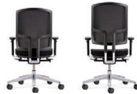
Der Verstellbereich des Netzurückens beträgt 70 mm. Rückenstab aus Aluminium poliert