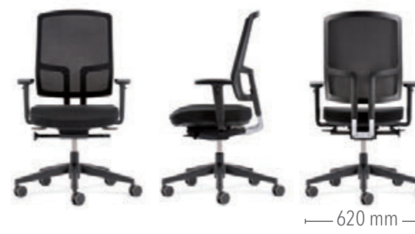
Mit Sitztiefeverstellung und Funktionsarmlehnen (2D) Gestell in Kunststoff schwarz