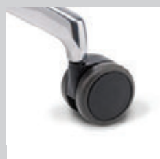
Rollen weich (für harte Böden)