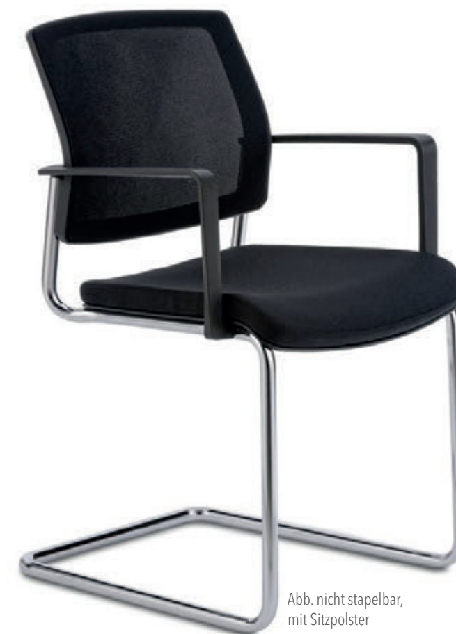
Abb. nicht stapelbar, mit Sitzpolster