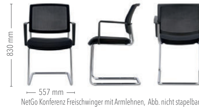
NetGo Konferenz Freischwinger mit Armlehnen, Abb. nicht stapelbar