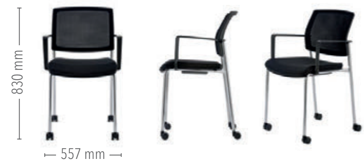
Vierfuß Konferenz mit Rollen