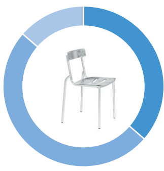
Lebensdauer / Verwendung der Teile