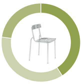
Gliederung der Teile in Zyklen